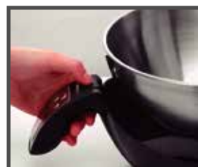
Tazón desmontable para facilitar su limpieza