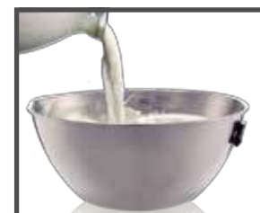
Tazón de acero inoxidable con graduación

SERVICIO Y REFACCIONES DISPONIBLES Contamos con una red de centros de servicio en toda la república: rhino.mx/servicio.html