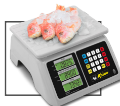
Ideal para pescaderías