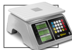
Incluye mica protectora