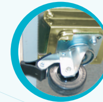
RUEDAS CON FRENO OPCIONAL