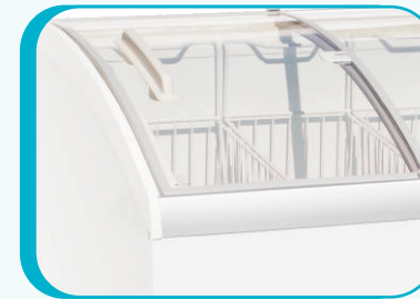
PUERTAS DE VIDRIO DESLIZABLES