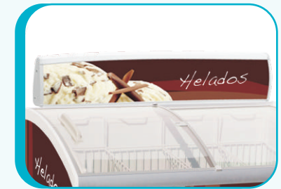
COPETE PROMOCIONAL OPCIONAL