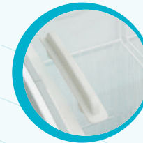
PUERTA CON JALADERA EN EL CRISTAL