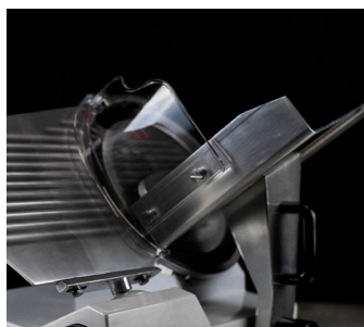
PROTECTOR DE ACRÍLICO